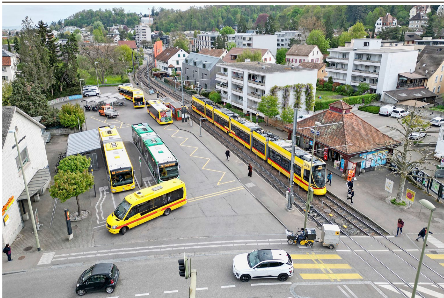
So sieht die Bottminger BLT-Tramstation samt BLT- und BVB-Busbahnhof heute aus. Neu gibt es rund um den alten Bahnhof rechts oben eine Tramschleife. Rechts vom Kiosk kommt ein Haus weg, ebenso die alte Post links unten mit Bibliothek und Migrolino.